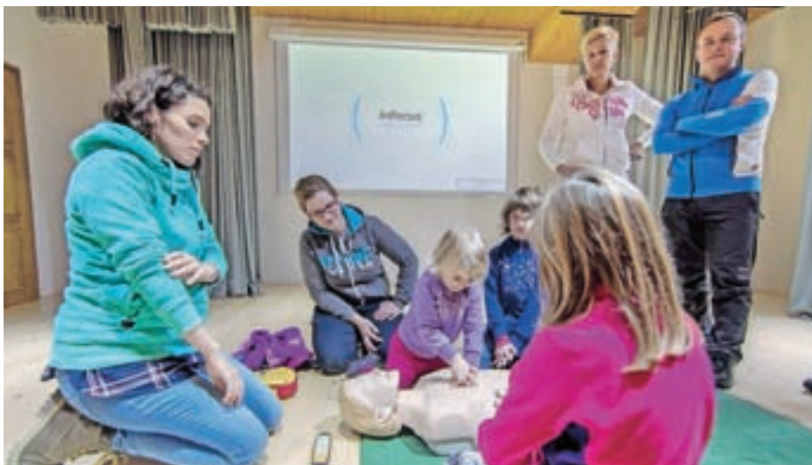
S tečaja o temeljnih postopkih oživljanja