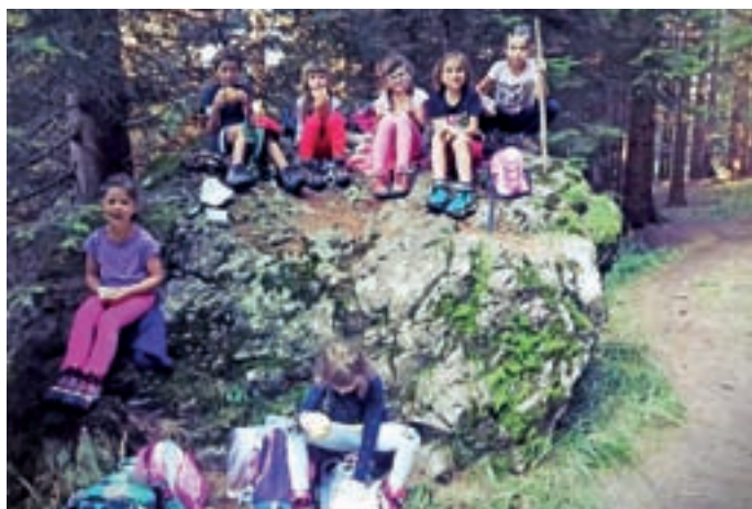
Celoletna šola športa poleti spodbuja tudi pohodništvo.