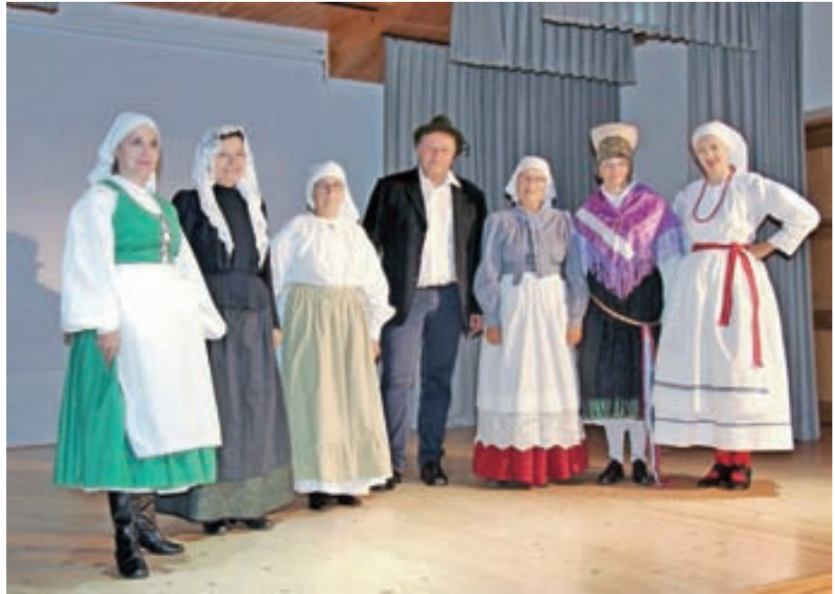
Pripovedovalci iz različnih slovenskih pokrajin

Vsem občanom in občankam občine Jezersko želimo srečne in vesele praznike.