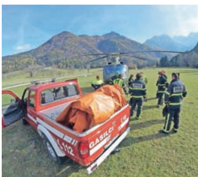
Z vaje Gozdni požar Jezerško 2017

jezero; ekipe polnijo bazen za helikoptersko gašenje in pomagajo pri zajemu vode;